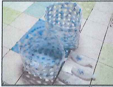
การสานตระกร้าจากขวดน้ำ