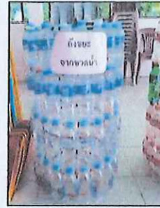
การทำถังขยะจากขวดน้ำ